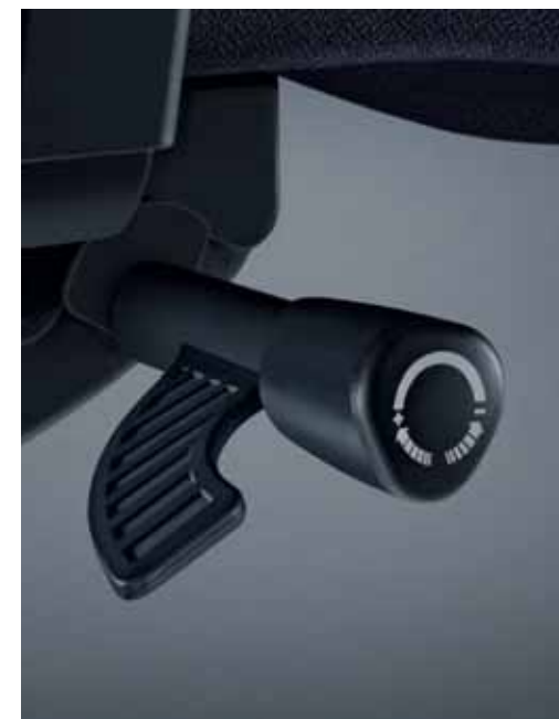
Une manette permet d'ajuster la tension et de régler la hauteur de façon simple et intuitive