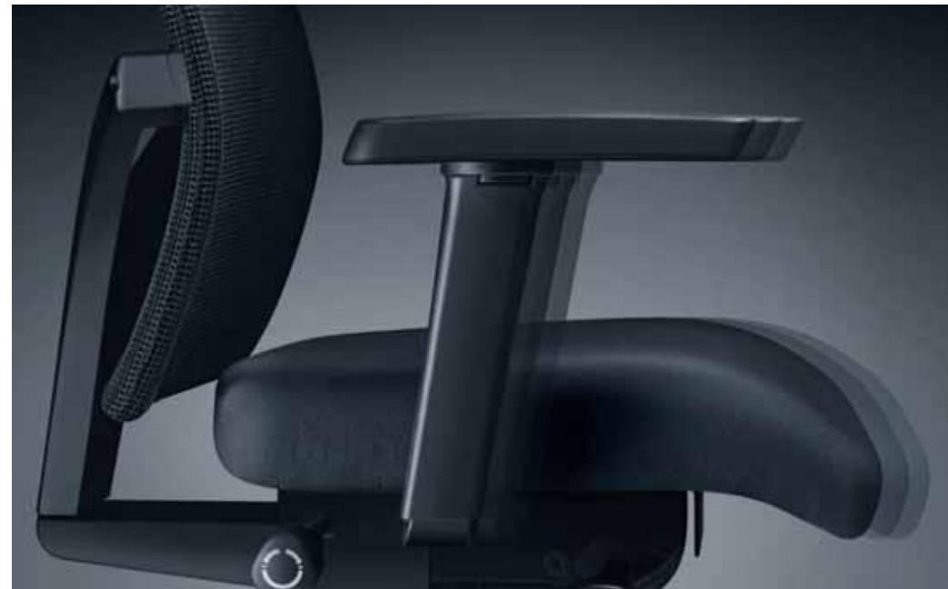
Profondeur d'assise et inclinaison peuvent être ajustées de façon personnalisée grâce à une manette