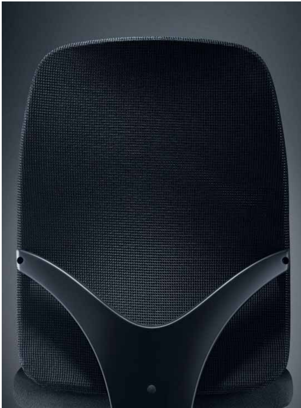
Geos se distingue par la structure en V soutenant le dossier et par le capitonnage des deux côtés du dossier