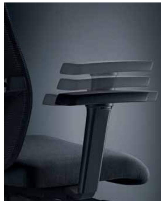
Accoudoirs en T – 4D , avec revêtement souple